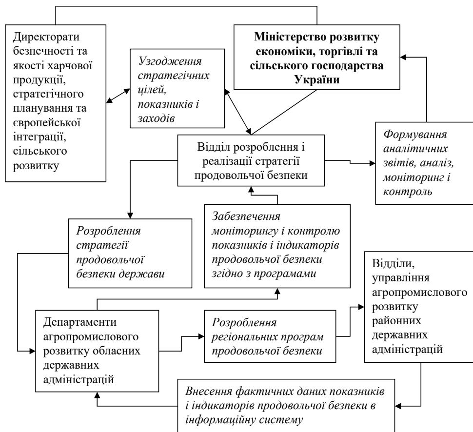
Рис. 3. Схема взаємодії державних, регіональних та місцевих органів виконавчої влади, Міністерства розвитку економіки, торгівлі та сільського господарства України щодо забезпечення формування і реалізації стратегії продовольчої безпеки держави

Для регулювання взаємодії учасників процесу розроблення стратегії продовольчої безпеки, координації дій і заходів, дотримання термінів рекомендовано затвердити на законодавчому рівні Порядок розроблення стратегії продовольчої безпеки, механізмів її реалізації, тактичних та оперативних заходів із забезпечення продовольчої безпеки, проведення моніторингу та оцінки результативності реалізації стратегії.