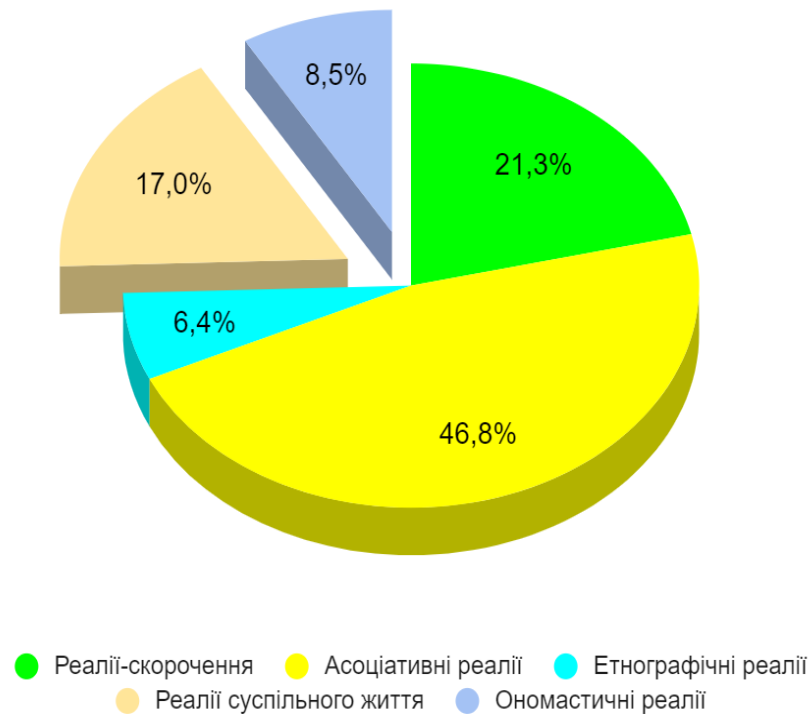
Рис.2.1 Класифікація реалій за категоріями

Дані проведеного аналізу у вигляді таблиці: