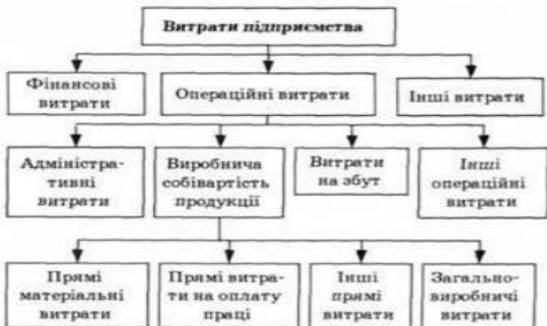
Рис. 1.1. Витрати виробництва та їх структура

У ТОВ "Сахара" це було досягнуто за рахунок: