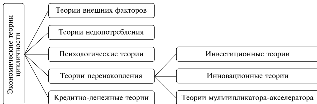
Рис. 2. Экономические теории цикличности

Заслуга Сисмонди заключается в том, что он выдвинул предположение о постоянстве кризисов перепроизводства в капиталистической экономике в противовес тезису классической политической экономии о невозможности общего кризиса перепроизводства в связи с