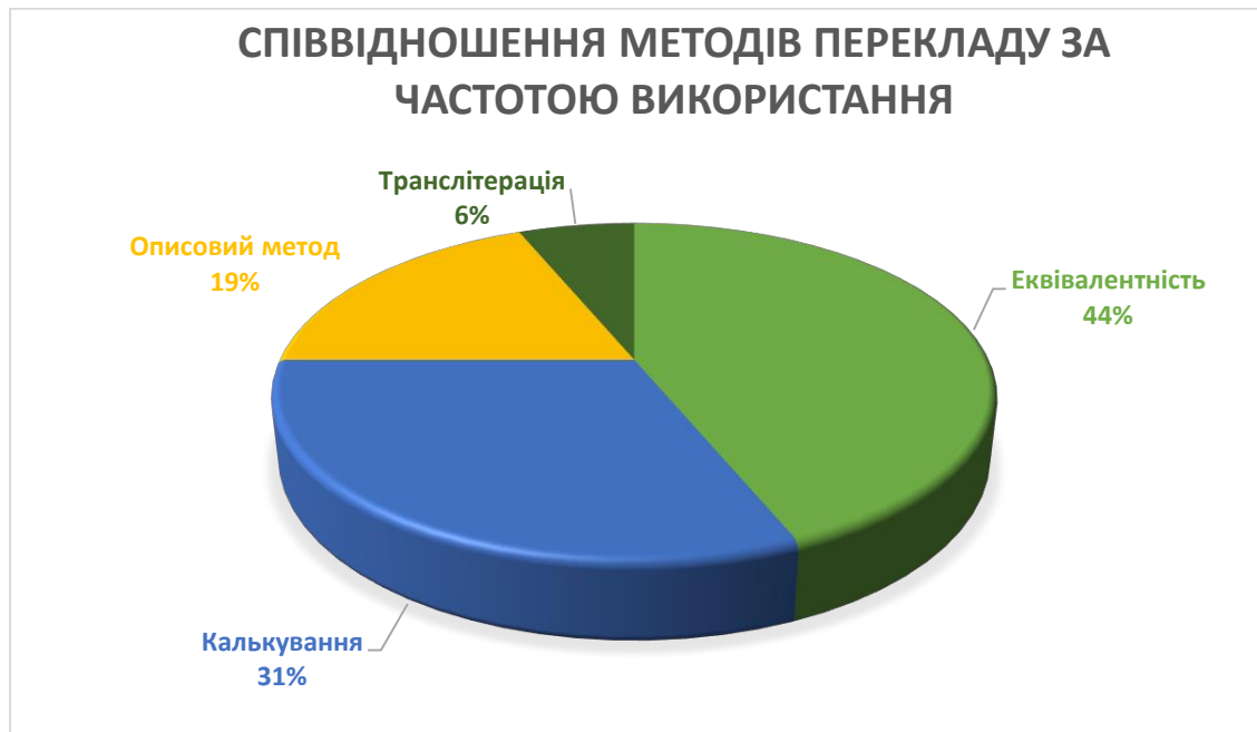
Діаграма 3.1. Співвідношення методів перекладу за частотою використання

який найкраще зможе передати сенс терміну. У підтвердження цього можуть слугувати дані, що відображає діаграма нижче (рис. 3.1).