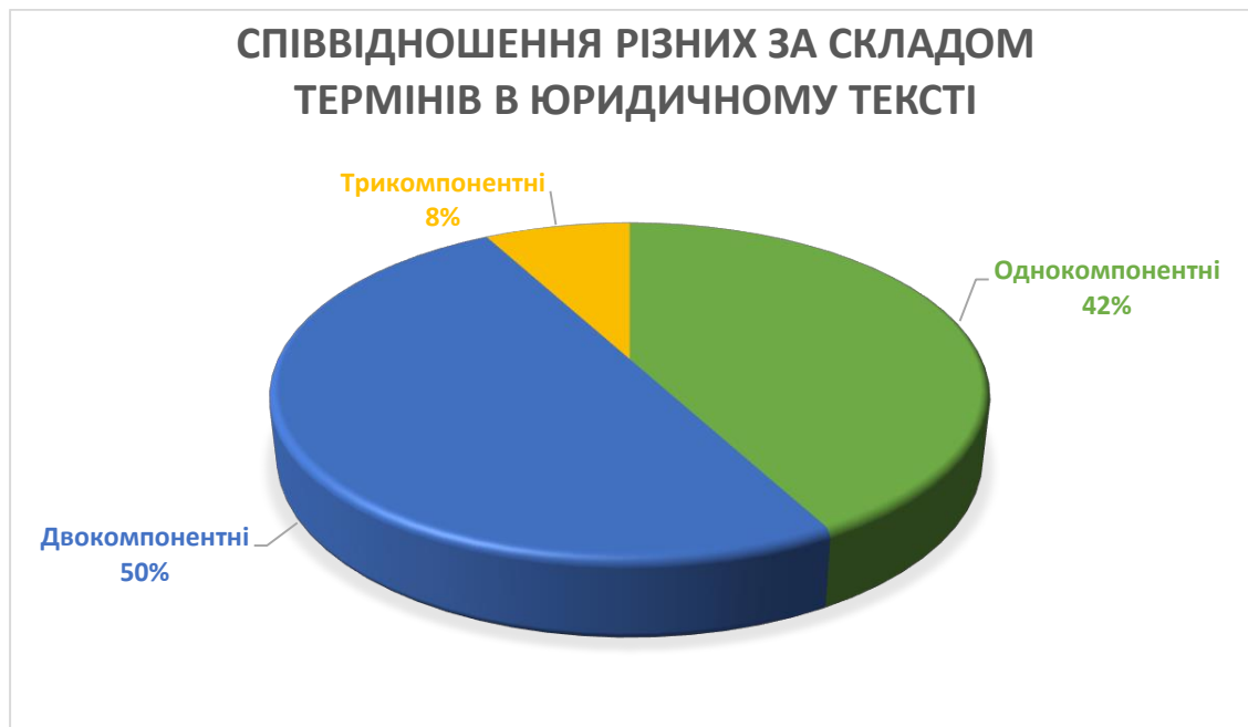
Діаграма 2.1. Співвідношення різних за складом термінів в юридичному тексті