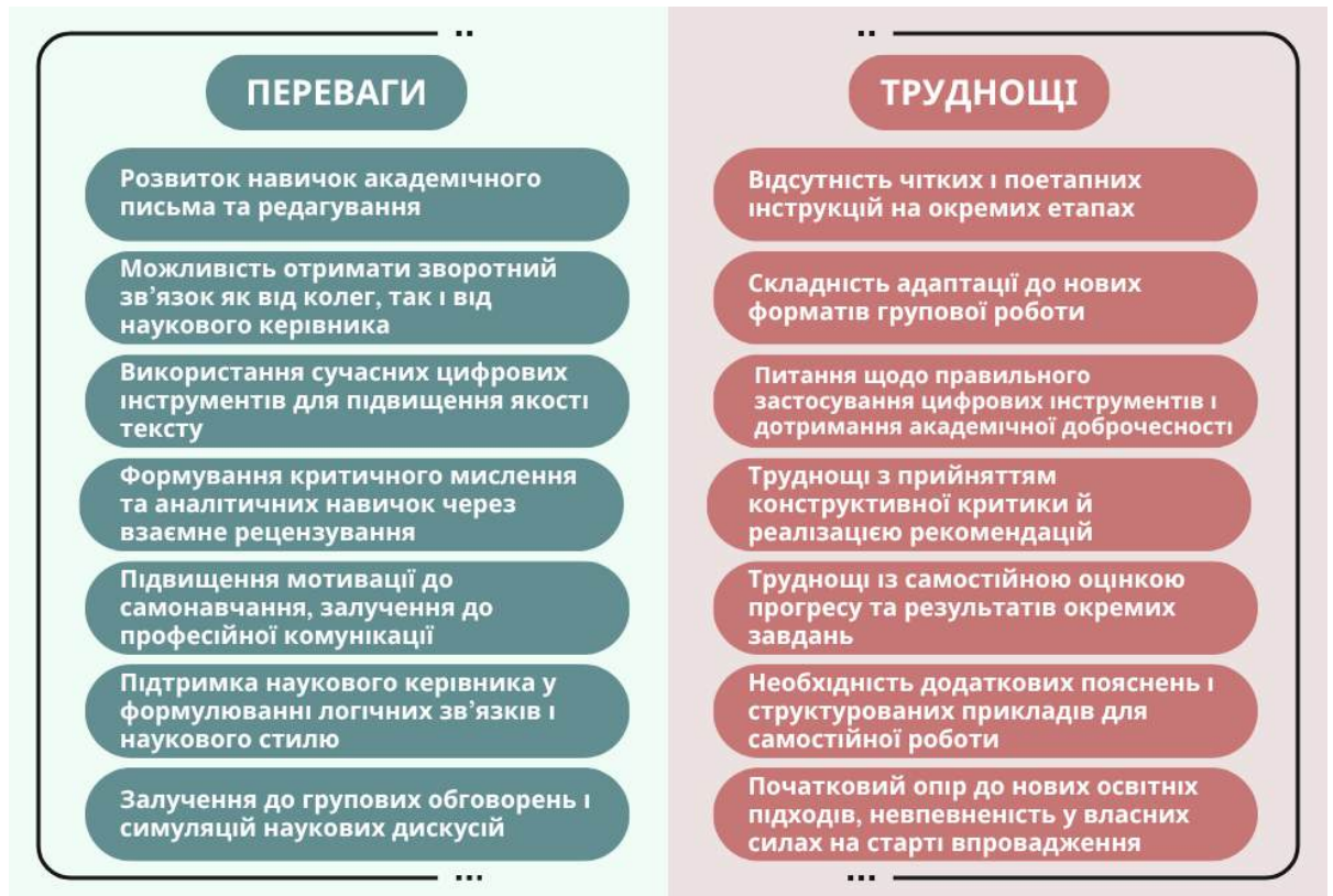
Рис.4. Переваги та труднощі впроваджених освітніх практик щодо формування мовної свідомості аспірантів

Аналіз зібраних відгуків дозволив виокремити низку як переваг, так і труднощів, із якими стикалися аспіранти під час опанування нових практик (див. рис. 4).