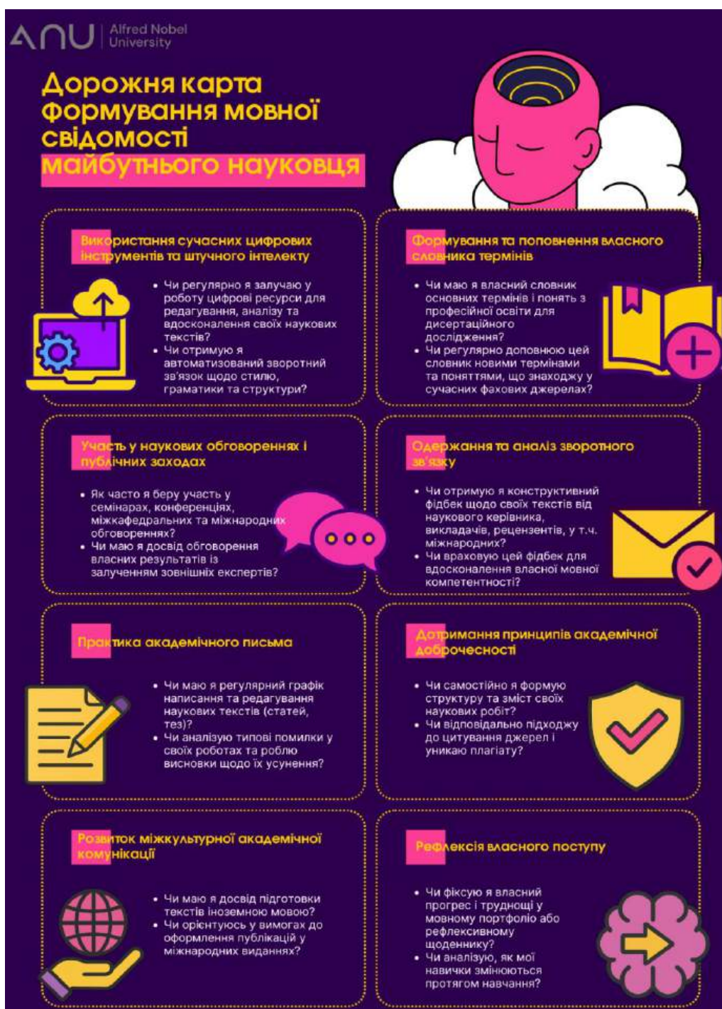
Рис. 5. Дорожня карта формування мовної свідомості майбутнього науковця

зрозумілого покрокового супроводу у формуванні мовної свідомості. Саме ці висновки стали підґрунтям для розробки дорожньої карти формування мовної свідомості майбутнього науковця (див. рис. 5). Запропонована карта є візуалізованою моделлю, що дозволяє вибудувати оптимальну освітню траєкторію, уникнути типових труднощів і забезпечити цілісність і результативність формування мовної свідомості аспірантів.