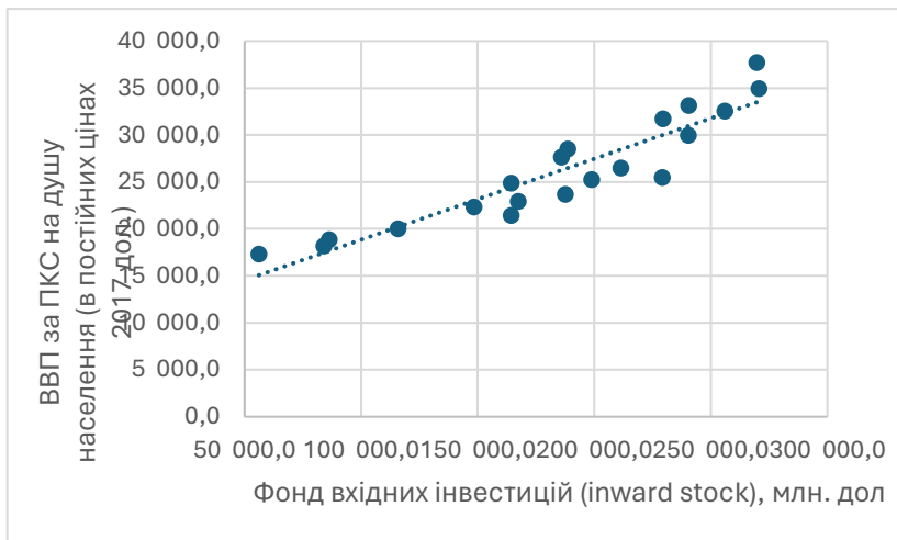
Рис. 1. Кореляційний аналіз між фондом вхідних інвестицій (inward stock) та ВВП ПКС на душу населення (в постійних цінах 2017 дол.) в Польщі, 2002-2022 рр.*

висновок, що країна зацікавлена в залученні ПІІ аби забезпечувати стрімкий та стабільний розвиток економіки і суспільства. Цей кореляційний аналіз, як і інші розрахунки, підтверджує вирішальний вплив ПІІ на розвиток економіки країни, що є інтегрованою в міжнародний економічний простір.